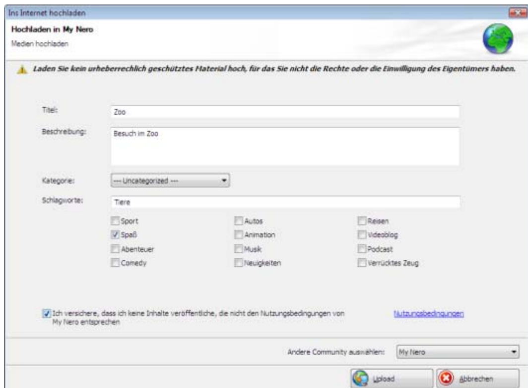
Fenster Ins Internet hochladen