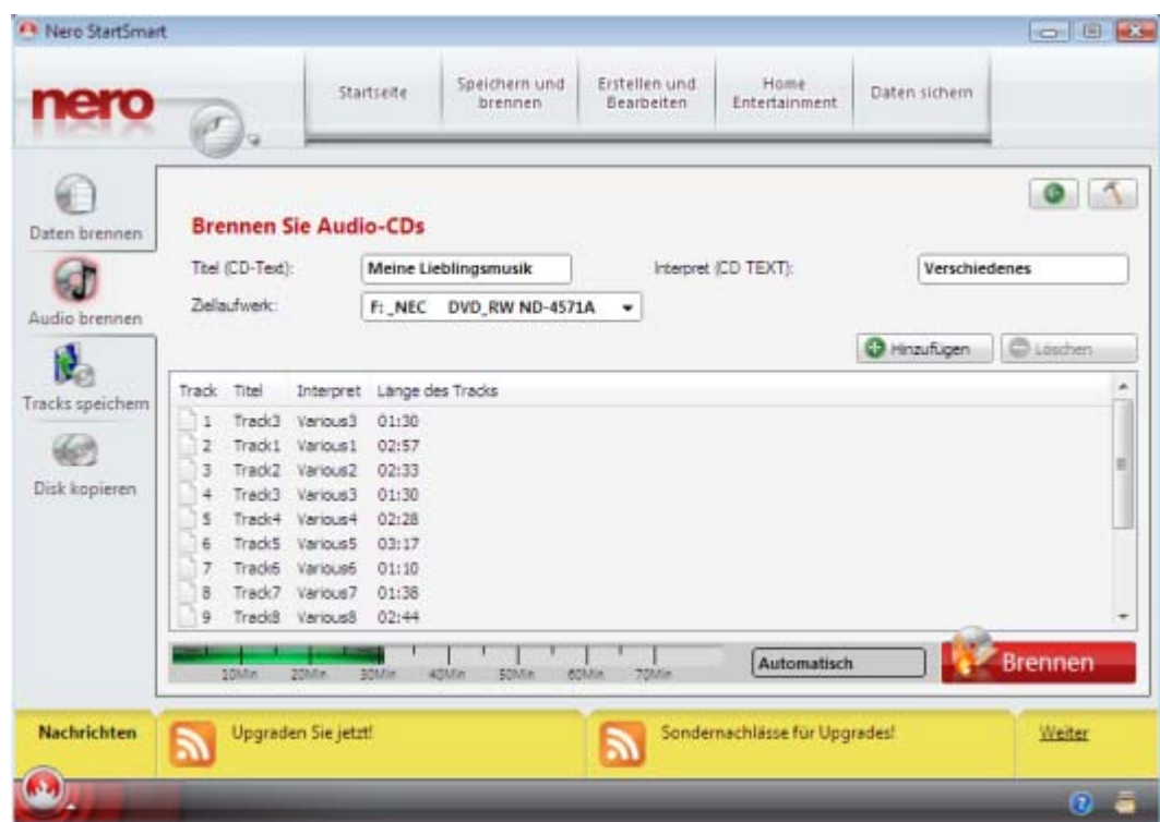
Bildschirm Brennen Sie Audio-CDs mit Audiodateien