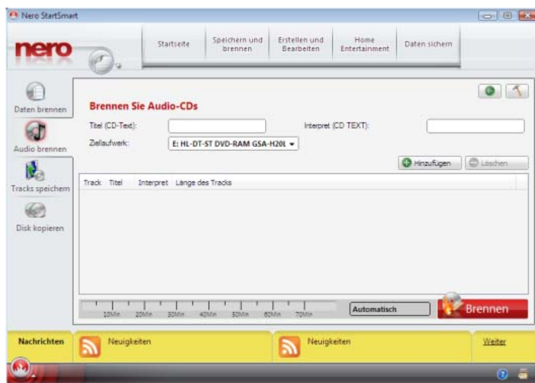
Bildschirm Brennen Sie Audio-CDs