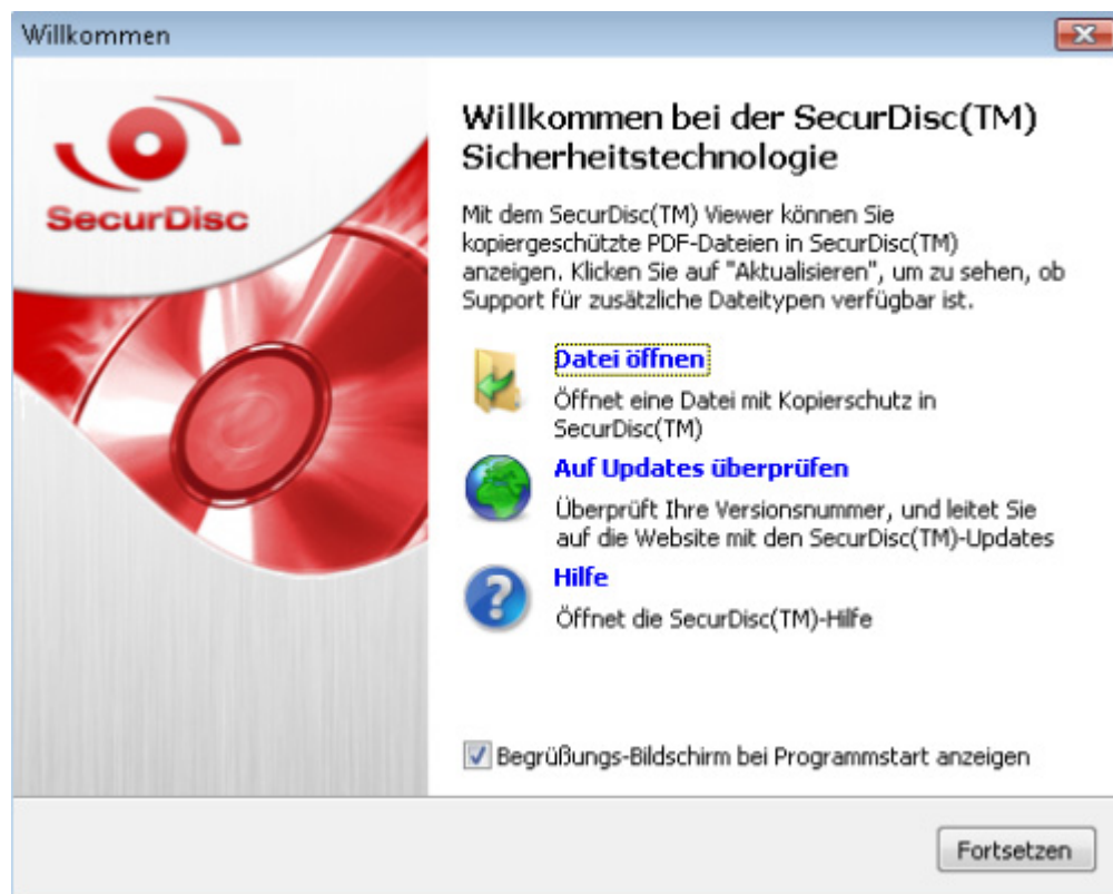
SecurDisc™ Viewer Startbildschirm